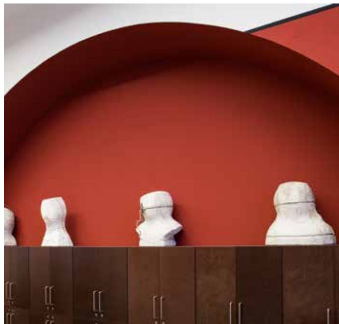
Støpeformer til gipsbyster som lå lagret på loftet formidler skolens historie. Moulds for casting plaster busts were found in the loft and speak of the history of the school.