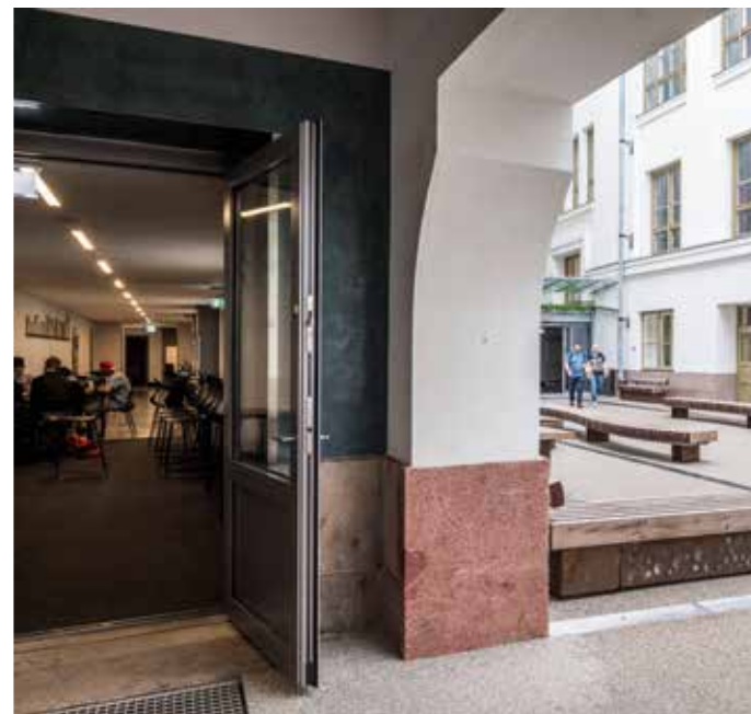
Fra portrommet ser man inn til kantinen, treverkstedene og den nye inngangen. From the entranceway you can see through the canteen. The new entrance is through the courtyard.

Følelsen av å komme inn bakveien er merkbar, men jeg forstår at plasseringen av inngangen nær heis og nye trapper er hensiktsmessig for fordeling av trafikken og gir en sterk forbedring av kommunikasjonen mellom etasjene. På denne måten har man også unngått de store inngrepene i den gamle vestibylen som ville vært nødvendige for å tilfredsstille kravet til tilgjengelighet.