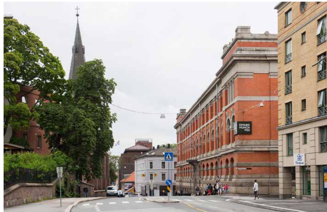
Et monumentalbygg i byen. Edvard Munch videregående skole sett fra Ullevålsveien. A monumental building in the city centre. Edvard Munch School seen from Ullevålsveien.

Et hovedgrep ved rehabiliteringen i 2015 var flyttingen av hovedinngangen fra Ullevålsveien til Nordahl Bruns gate, til porten som tidligere var inngang til bakgården. Dette grepet gjør at forståelsen av den historiske bygningens ærverdige uttrykk med en klassisk hovedinngang er borte. Men ved nærmere bekjentskap med den nye skolen ser jeg at det var et klokt valg. Det historiske motivet måtte ofres av praktiske og funksjonelle hensyn, til fordel for romslig plass til at flere hundre skoleelever kan komme seg farefritt inn og ut, og for å få til en trinnfri adkomst inn i bygget. En så dramatisk endring av adkomst-